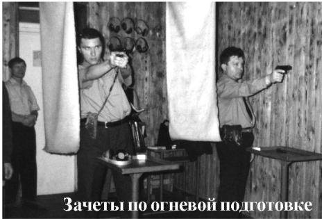
Зачеты по огневой подготовке

ИНФОРМАЦИОННЫЙ БЮЛЛЕТЕНЬ СТАХАНОВСКОГО ГО УМВД Май 2003 г. № 5 (29)