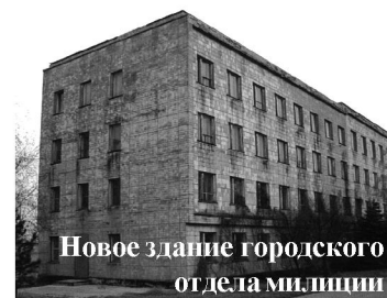
Новое здание городского отдела милиции